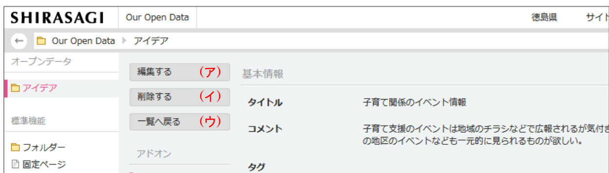
アイデア詳細画面

2.3 「保存」もしくは「キャンセル」をクリックするとアイデア詳細画面に移動します。